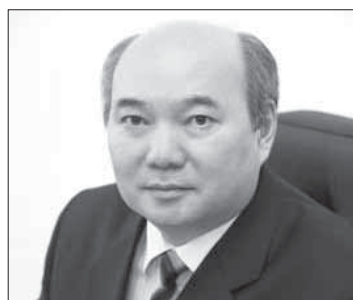
Б.Т. ЖУМАГУЛОВ. Министр образования и науки Республики Казахстан, академик НАН РК