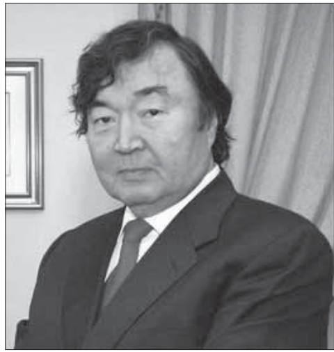
Қыркүйек айының 14 күні Қарағанды мемлекеттік университетінде атаулы үлкен оқиға болып өтті.

Ақын, жазушы, қоғам қайраткері, тілтанушы ғалым, «Невада-Семей» ядролық сынақтарына қарсы қозғалыстың көшбасшысы Олжас Омарұлы Сүлейменов Қарағанды қаласына келді. Кездесуге Қарағанды мемлекеттік университетінің, басқа да жоғары оқу орындарының студенттері және оқытушылары, сондай-ақ көптеген қонақтар қатысты.