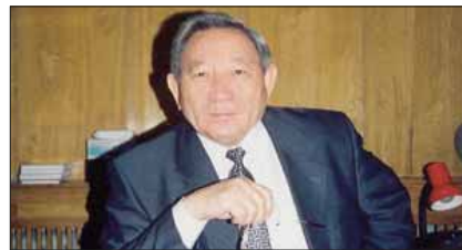
Еділ Ерғожаұлы Ерғожин, ҚР ҰҒА академигі: