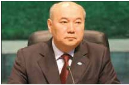
Б. Т. Жумагулов, министр образования и науки Республики Казахстан, академик НАН РК:

— Основанный в 1972 году Карагандинский государственный университет стал признанным высшим учебным заведением в Республике Казахстан, достижения которого подтверждаются высокими позициями в национальном рейтинге и в мировом академическом сообществе. Ежегодно университет выпускает более трех тысяч высококвалифицированных специалистов, подготовка которых осуществляется на 13 факультетах по 78 специальностям бакалавриата, 49 специальностям магистратуры и 6 специальностям докторантуры, которые востребованы как в Казахстане, так и в других странах. Сегодня университет является одним из крупных научных центров, осуществляющим фундаментальные и прикладные исследования по актуальным научным направлениям. В структуре университета функционируют 6 научно-исследовательских институтов и 44 научно-исследовательских лаборатории. Вклад студентов, магистрантов и ученых КарГУ в развитие образования, науки, экономики и культуры получил высокую оценку государства и общественности. В числе преподавателей вуза — обладатели государственной стипендии для ученых и специалистов, внесших выдающийся вклад в развитие науки и техники, государственного гранта «Лучший преподаватель вуза», гранта Фонда Первого Президента Республики Казахстан для проведения молодыми учеными фундаментальных и прикладных научных исследований. Уверен, что университет и в дальнейшем будет способствовать укреплению позиций высшего и послевузовского образования Республики Казахстан.