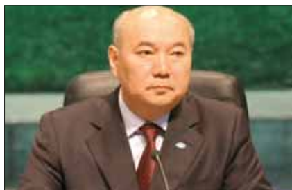
Б. Т. Жумагулов, министр образования и науки Республики Казахстан, академик НАН РК:

— Основанный в 1972 году Карагандинский государственный университет стал признанным высшим учебным заведением в Республике Казахстан, достижения которого подтверждаются высокими позициями в национальном рейтинге и в мировом академическом сообществе. Ежегодно университет выпускает более трех тысяч высококвалифицированных специалистов, подготовка которых осуществляется на 13 факультетах по 78 специальностям бакалавриата, 49 специальностям магистратуры и 6 специальностям докторантуры, которые востребованы как в Казахстане, так и в других странах. Сегодня университет является одним из крупных научных центров, осуществляющим фундаментальные и прикладные исследования по актуальным научным направлениям. В структуре университета функционируют 6 научно-исследовательских институтов и 44 научно-исследовательских лаборатории. Вклад студентов, магистрантов и ученых КарГУ в развитие образования, науки, экономики и культуры получил высокую оценку государства и общественности. В числе преподавателей вуза — обладатели государственной стипендии для ученых и специалистов, внесших выдающийся вклад в развитие науки и техники, государственного гранта «Лучший преподаватель вуза», гранта Фонда Первого Президента Республики Казахстан для проведения молодыми учеными фундаментальных и прикладных научных исследований. Уверен, что университет и в дальнейшем будет способствовать укреплению позиций высшего и послевузовского образования Республики Казахстан.