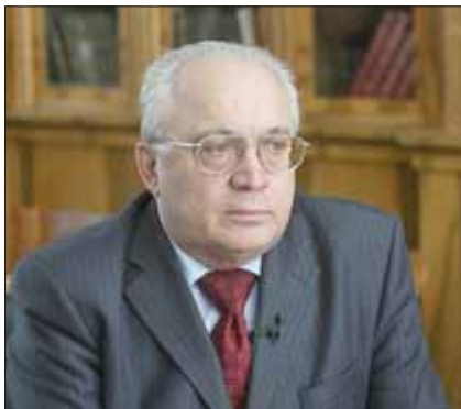
В. А. Садовничий, Президент Евразийской ассоциации университетов, ректор МГУ им. М. В. Ломоносова, академик РАН:

— Карагандинский государственный университет имеет богатую историю. Он является одним из крупнейших центров высшего образования, культуры и науки Казахстана, пользуется высоким международным авторитетом. Многолетнее участие вашего университета в деятельности Евразийской ассоциации университетов служит решению благородной задачи сохранения единого научного и образовательного пространства стран СНГ.