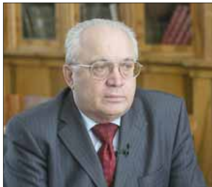
В. А. Садовничий, Президент Евразийской ассоциации университетов, ректор МГУ им. М. В. Ломоносова, академик РАН:

— Карагандинский государственный университет имеет богатую историю. Он является одним из крупнейших центров высшего образования, культуры и науки Казахстана, пользуется высоким международным авторитетом. Многолетнее участие вашего университета в деятельности Евразийской ассоциации университетов служит решению благородной задачи сохранения единого научного и образовательного пространства стран СНГ.