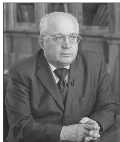
Виктор Антонович Садовничий, вице-президент Российской академии наук, ректор МГУ им. М. В. Ломоносова:

— Карагандинский государственный университет имеет богатую историю. Он является одним из крупнейших центров высшего образования, культуры и науки Казахстана, пользуется высоким международным авторитетом. Многолетнее участие вашего университета в деятельности Евразийской ассоциации университетов служит решению благородной задачи сохранения единого научного и образовательного пространства стран СНГ.