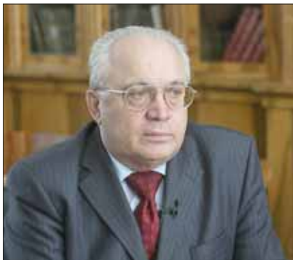
В. А. Садовничий, Президент Евразийской ассоциации университетов, ректор МГУ им. М. В. Ломоносова, академик РАН:

— Карагандинский государственный университет имеет богатую историю. Он является одним из крупнейших центров высшего образования, культуры и науки Казахстана, пользуется высоким международным авторитетом. Многолетнее участие вашего университета в деятельности Евразийской ассоциации университетов служит решению благородной задачи сохранения единого научного и образовательного пространства стран СНГ.