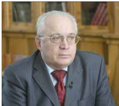
В. А. Садовничий, Президент Евразийской ассоциации университетов, ректор МГУ им. М. В. Ломоносова, академик РАН:

— Карагандинский государственный университет имеет богатую историю. Он является одним из крупнейших центров высшего образования, культуры и науки Казахстана, пользуется высоким международным авторитетом. Многолетнее участие вашего университета в деятельности Евразийской ассоциации университетов служит решению благородной задачи сохранения единого научного и образовательного пространства стран СНГ.