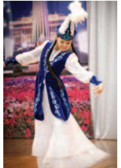
спорта — все они будут награждены магнитами. Мы поздравляем победителей и желаем им новых творческих свершений!

По итогам конкурса «Жас талап» лауреатами стали 47 студентов первого курса. Гран-при получили студенты социально-педагогического факультета, им от профкома КарГУ подарят музыкальный центр. Первое место занял экономический факультет, а второе и третье места разделили химический факультет и факультет физкультуры и